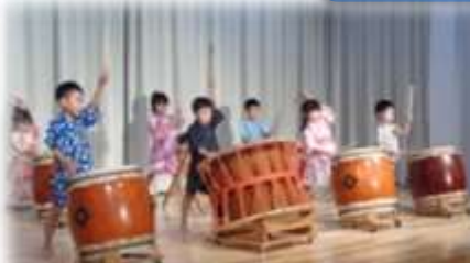
オープニング はと組 和太鼓